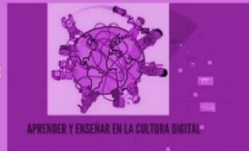
APRENDER Y ENSEÑAR EN LA CULTURA DIGITAL

Para algunos educadores, los medios digitales proporcionan más y mejores recursos para la enseñanza y permiten un mayor control de la acción de los alumnos, sobre todo si están en línea y con programas que permiten hacer un seguimiento pormenorizado