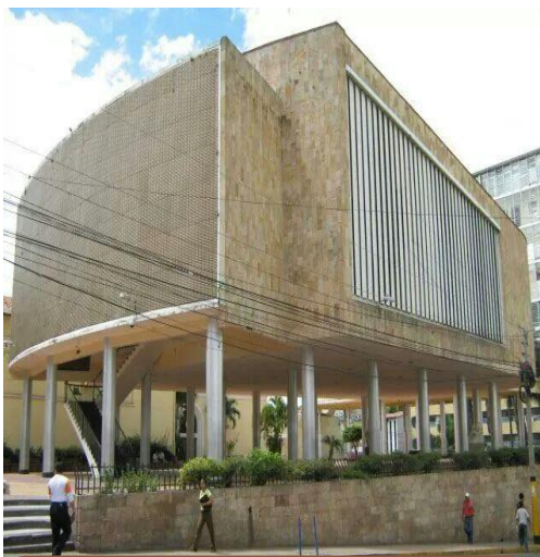
Congreso Nacional de Honduras