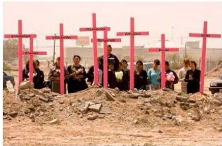
Caso González y otras (“Campo Algodonero”) Vs. México de 16 de noviembre de 2009