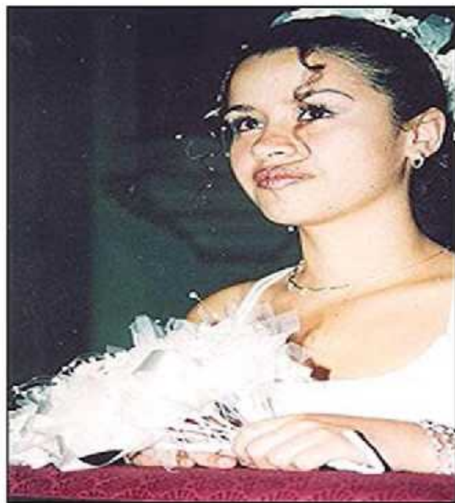
Caso Véliz Franco y otros Vs. Guatemala de 19 de mayo de 2014