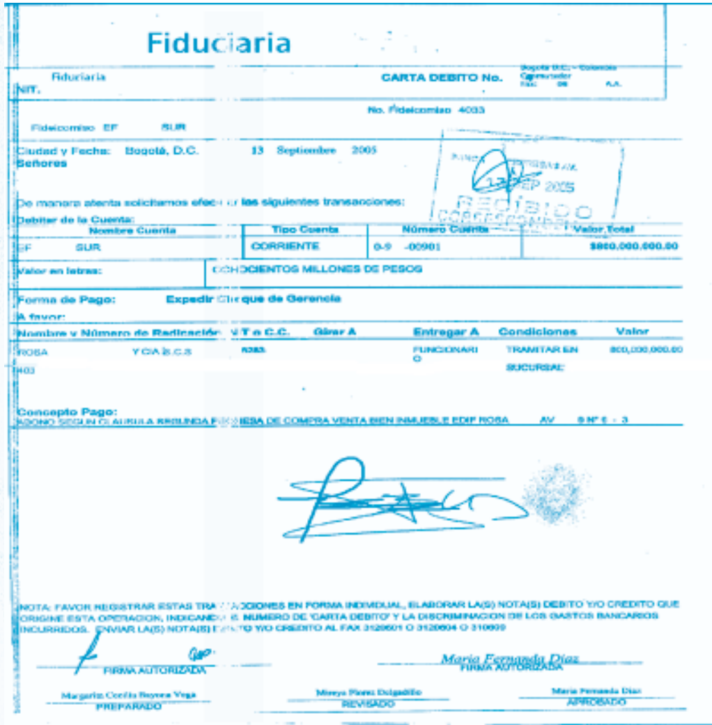
Imagen No. 24 Comprobante de pago a favor o por cuenta del fideicomitente

El comprobante de pago (cheques girados o transferencias ordenadas) que realiza la fiduciaria a favor o por cuenta del fideicomitente contiene información relativa a la fecha de pago, forma de pago, monto del pago, oficina de la sociedad fiduciaria que realiza el pago, nombre e identificación del beneficiario y firmas autorizadas de la fiduciaria.