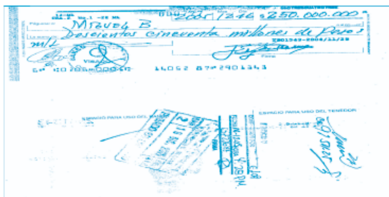
Imagen No. 5 Cheque