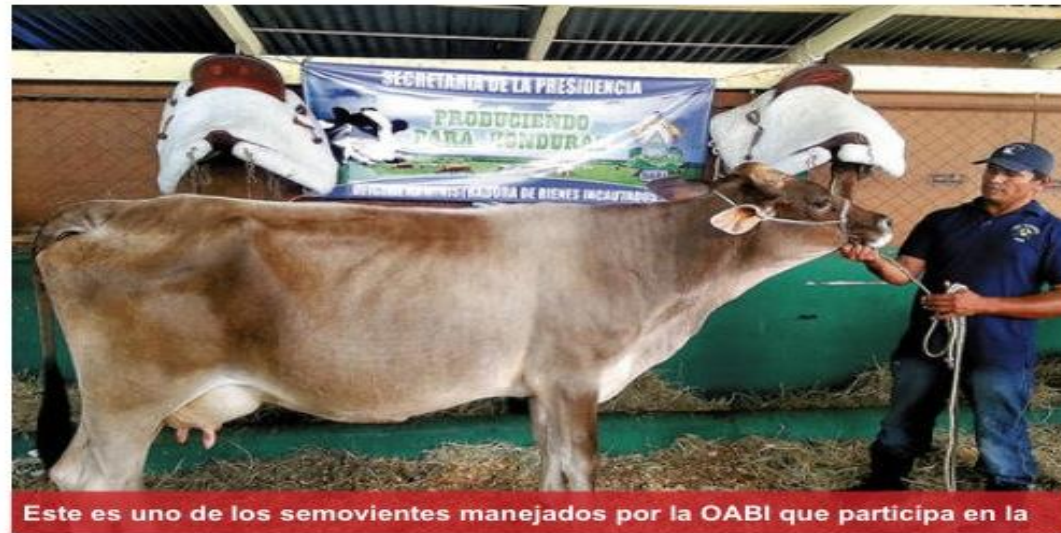
Este es uno de los semovientes manejados por la OABI que participa en la