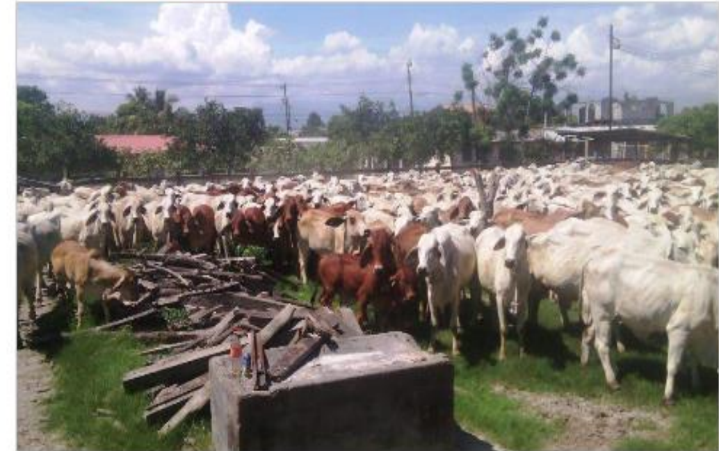
El ganado fue asegurado en el Rancho Lima Corral, en Cortés, zona norte de Honduras.